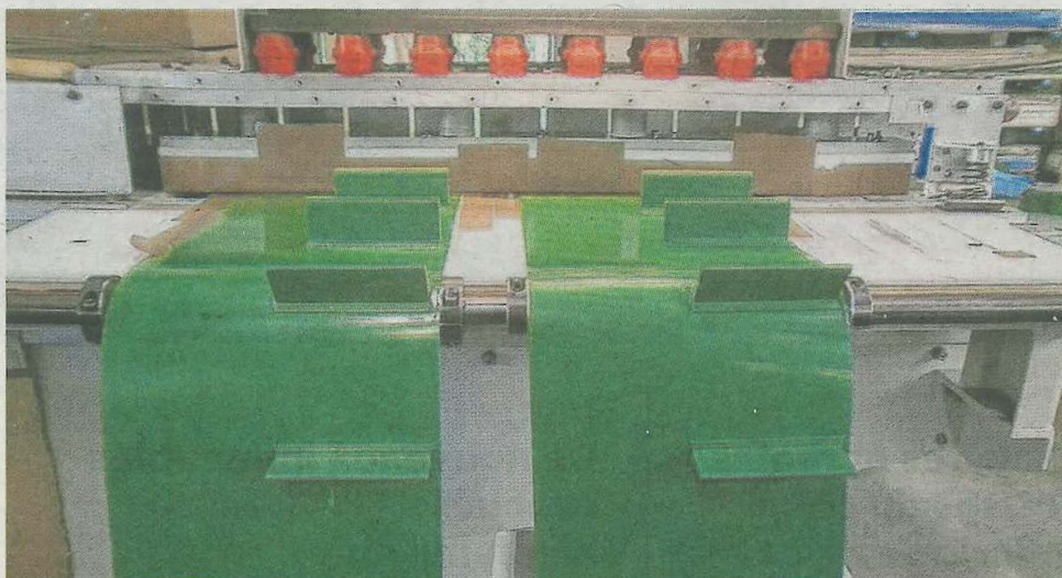
Certaines bandes sont équipées de tasseaux, notamment pour maintenir les produits convoyés.